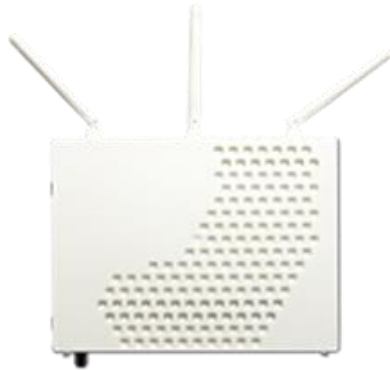
Fiberboks med indbygget router